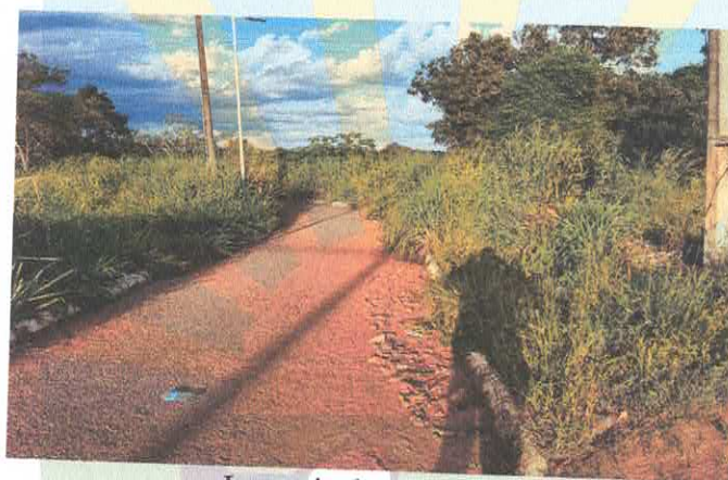
Laterais da Ciclovia.