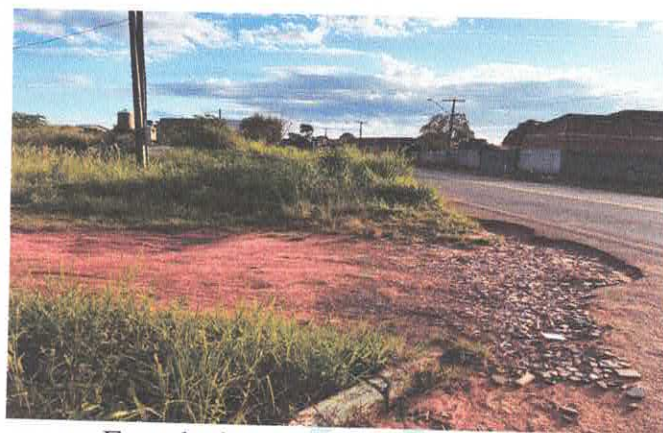
Entrada da Ciclovia acesso pela TO.